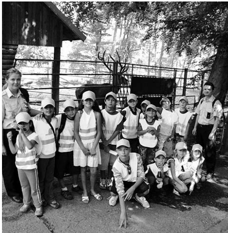
■ Děti se na táboře mohly svést na koni a podívaly se do zoo a útulku pro psy