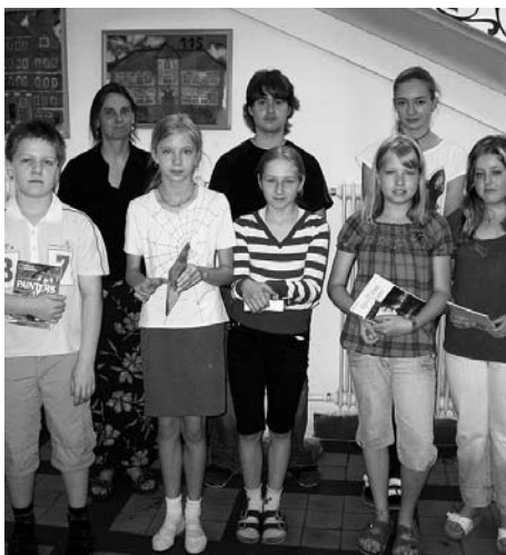
■ Soutěžící byli za svůj výkon odměněni anglickými knihami, slovníky a CD